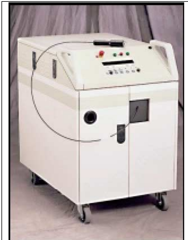
Laser Xtrac développé et commercialisé par la société Photomedex. www.photomedex.com

Dans le cas du laser Xtrac développé par la société Photomedex, le faisceau est délivré au moyen d'une pièce à main (spot de 2.5cm cm de diamètre) connecté au laser Excimère par un faisceau de fibres optiques. Ce laser délivre des trains d'impulsions dont la durée varie de 20 à 40ns à une cadence de 50 à 100Hz. Chaque impulsion ayant une énergie de 5mJ, un temps d'exposition de 1 seconde est donc nécessaire afin d'obtenir 500mJ. Un traitement réalisé sur une zone de 4.9cm 2 (spot de 2.5cm) avec une fluence de l'ordre de 3J/cm 2 , nécessite donc un temps d'exposition de l'ordre de 15 sec.