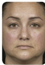
Antes de Clear + Brilliant® Permêa