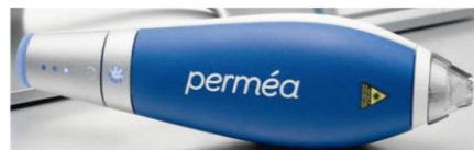
Handpiece Perméa – 1927 nm

Prevenir sinais de envelhecimento Textura renovada, ultra macia e suave Minimizar a aparência dos poros Aumentar a firmeza e a elasticidade da pele