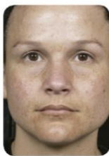
Antes de Clear + Brilliant®