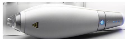
Handpiece – 1440 nm

O equipamento possui dois diferentes handpieces: