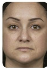
1 mês após 4 a 6 tratamentos