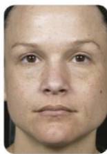
1 mês após 4 a 6 tratamentos